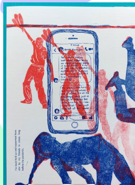
Une exemple du risographie pris du magazine 'BUM', article écrit et dessiné par Natalie Oleinik